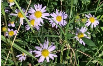
農園に咲くノコンギク

10月のめあて 落ち着いて学習に取り組もう 10月のなかま もっともっと聴き合おうよ